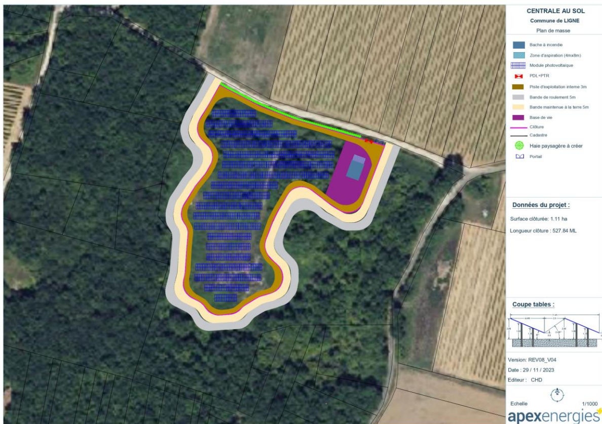
Figure 1 - Nouvelle implantation du parc photovoltaïque au sol

Pour donner suite aux différents avis rendus au cours de l'instruction du dossier de permis de construire de ce projet de parc photovoltaïque, une mise à jour de l'implantation a pu être réalisée.